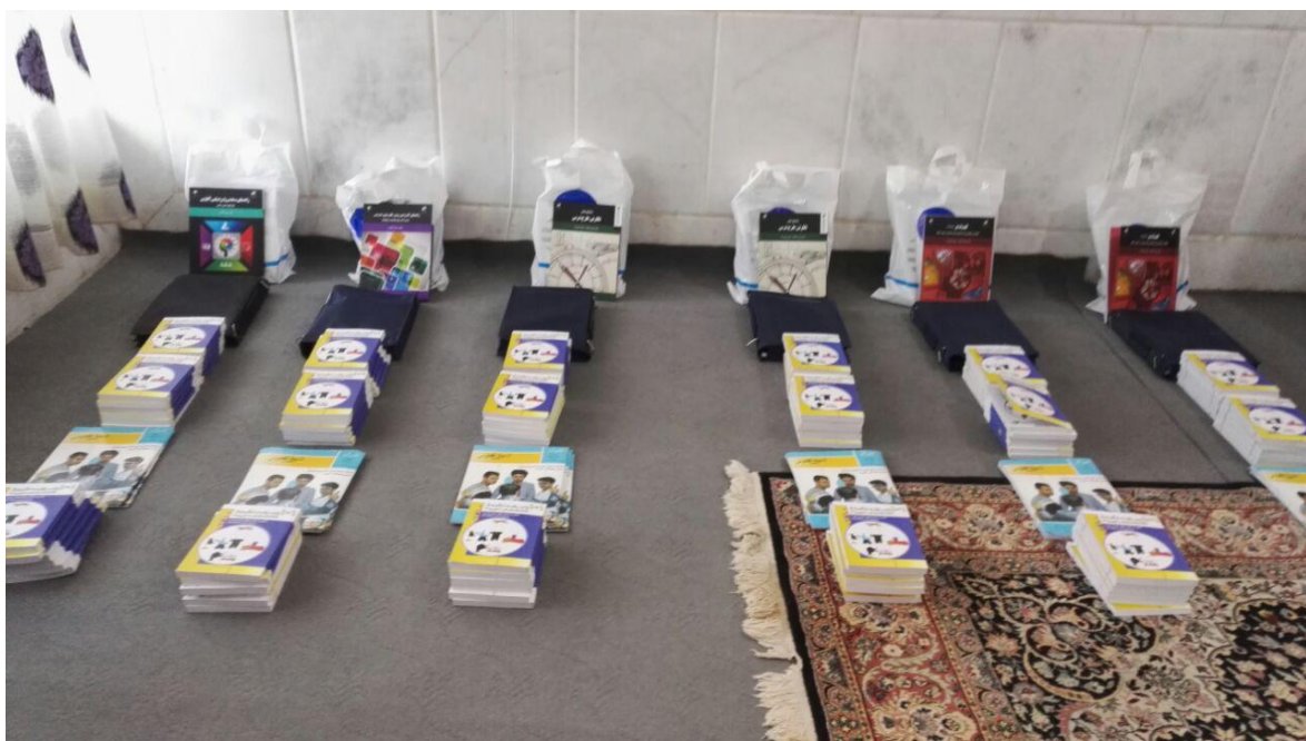
اهدای کتاب جهت تجهیز کتابخانه های تخصصی معلمان