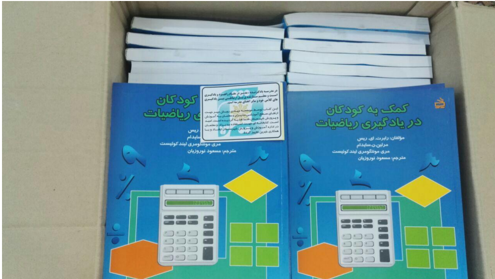
اهدای کتاب های تخصصی متناسب با کارگاه