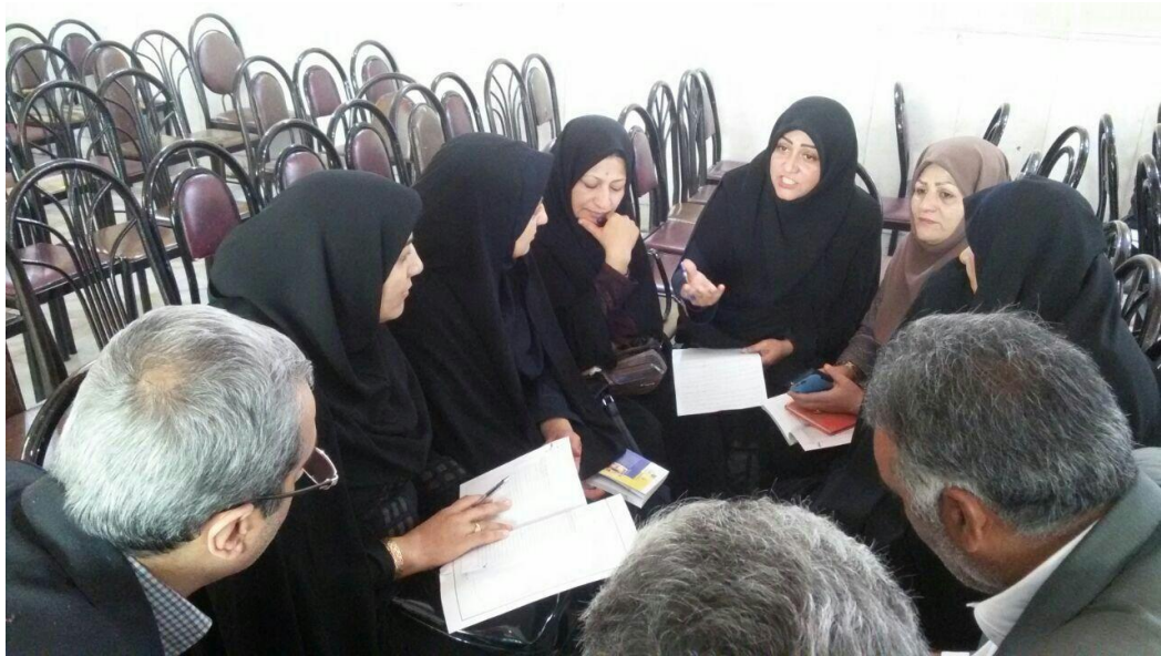
حضور دکتر در گروه های تشکیل شده و مشارکت در بحث