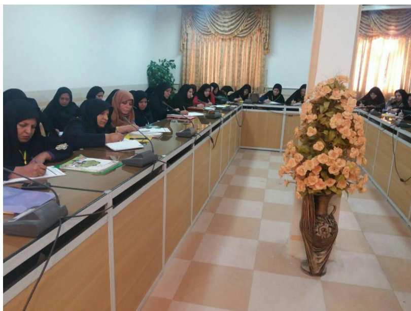
کارگاه درس بخوانیم و بنویسیم