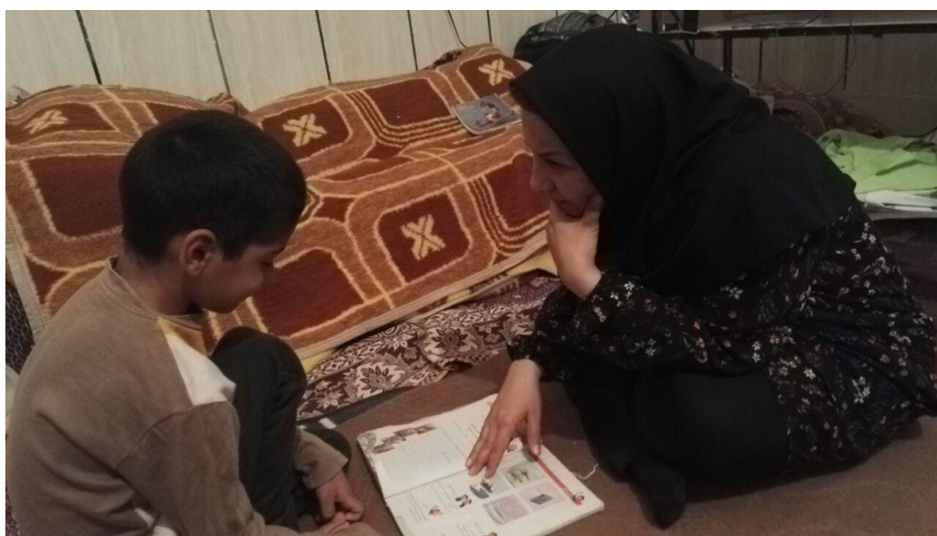
استعداد سنجی دانش آموزی باهوش ولی بی بضاعت