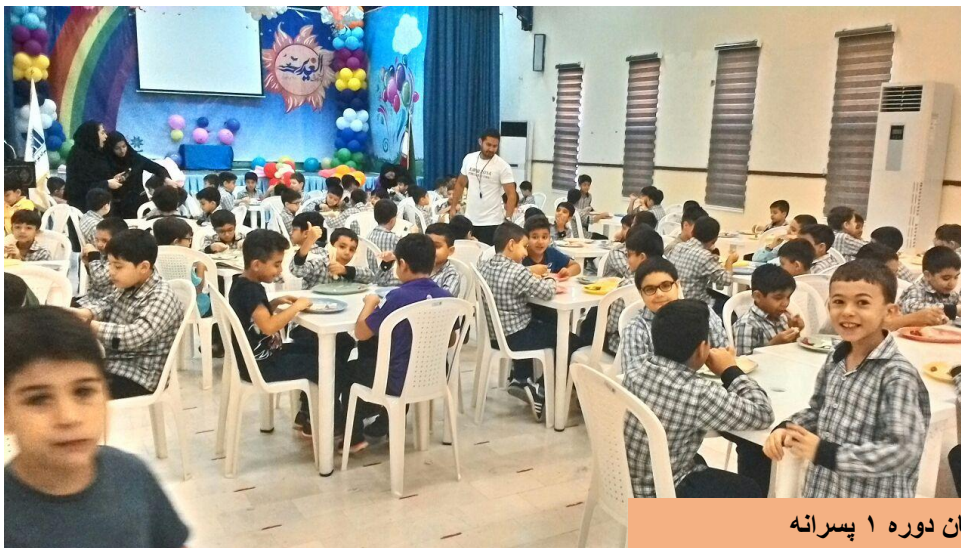
پذیرایی صبحانه در دبستان دوره ۱ پسرانه