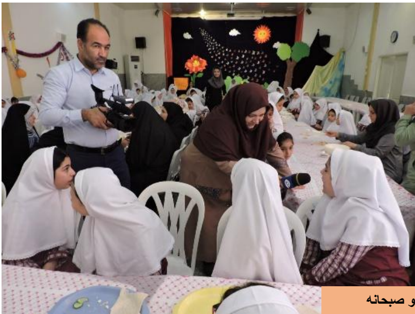
پوشش خبری صدا و سیما کیش از سرو صبحانه