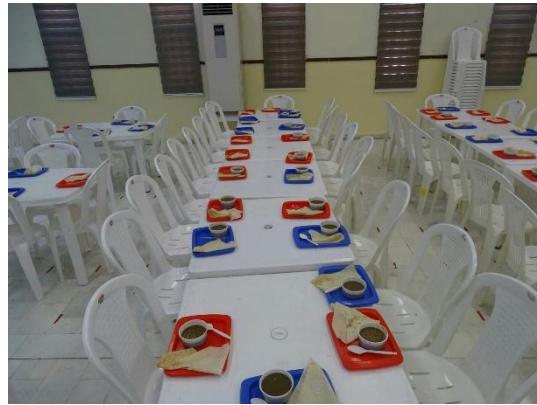
آماده سازی سالن صبحانه خوری