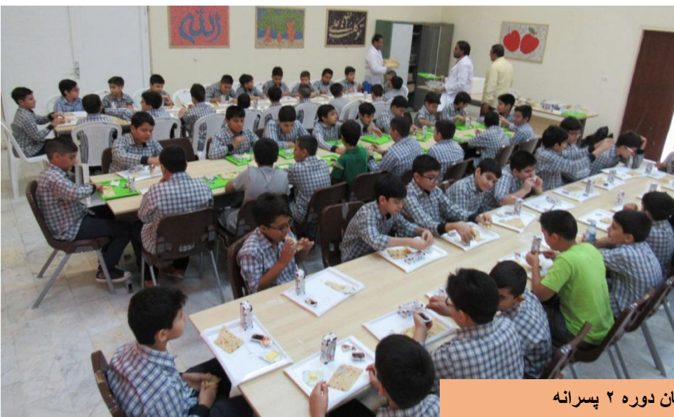
پذیرایی صبحانه در دبستان دوره ۲ پسرانه