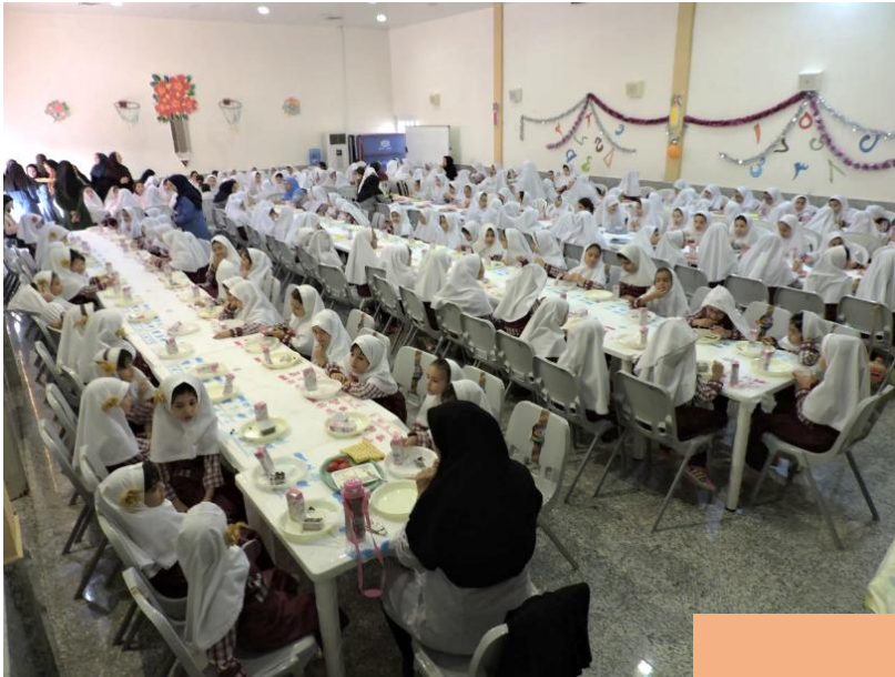
پذیرایی صبحانه در دبستان دخترانه