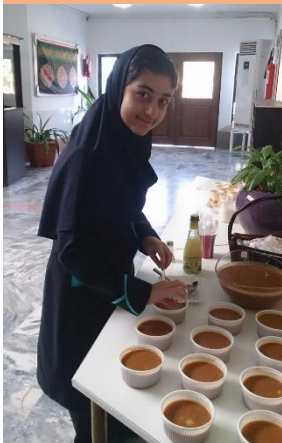
پذیرایی صبحانه در متوسطه دوره ۱ دخترانه